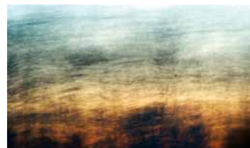
Vlucht voor de schemering